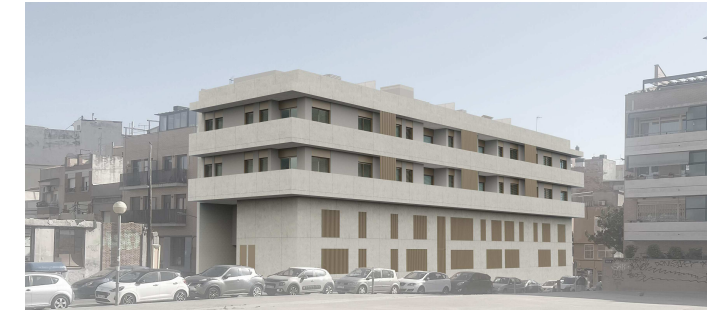
FONT I ESCOLÀ Font i Escolà 24 30 Badalona